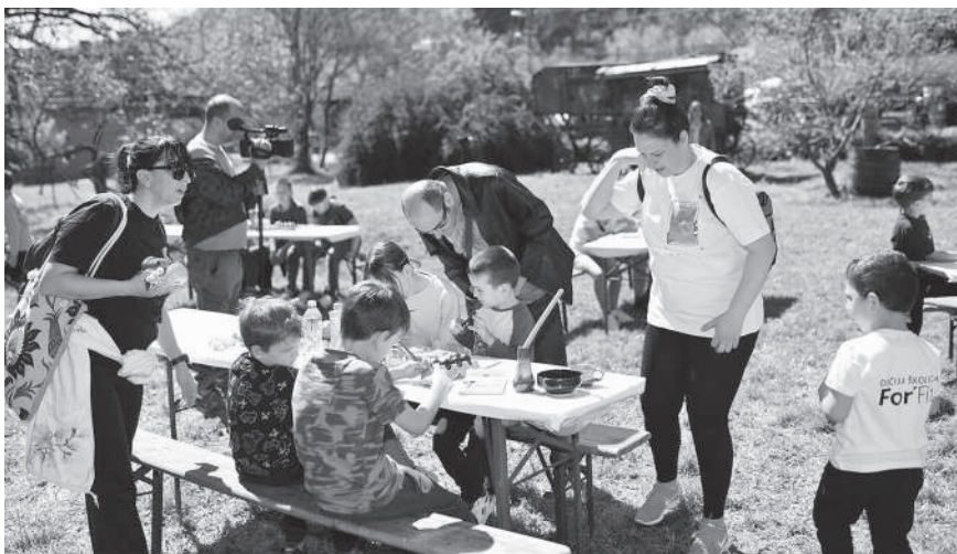
Традиционално бојење васкршњих јаја у дворишту Етно куће, уз благослов свештенства и наших драгих пријатеља из Удружења „Деца у срцу“