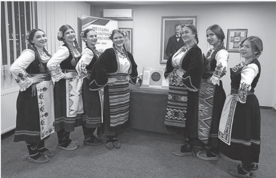
Чланице КУД-а „Електорцелан“ из Аранђеловца које су својим песмама увеличале доделу признања