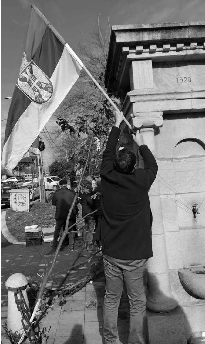
Припреме за održavaње Бадњег дана