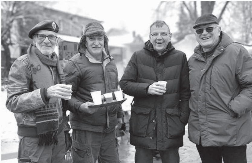
Бадњи дан, 2025, пријатељско дружење