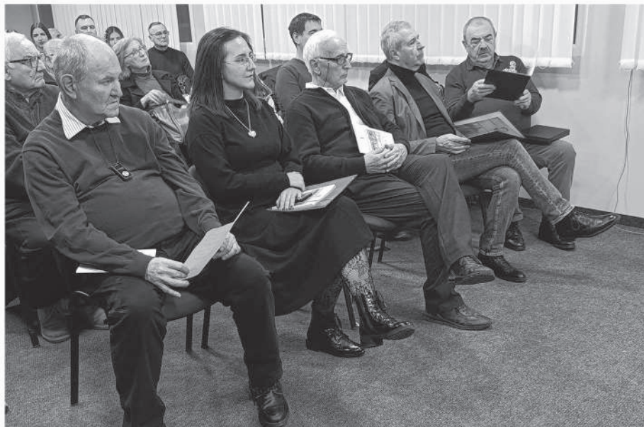
Лауреати признања „Миле Недељковић“ за 2025. годину