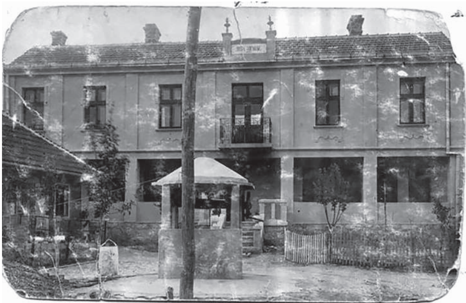
Изглед Виле „Здравље“, непосредно после завршета првог дела 1927. године