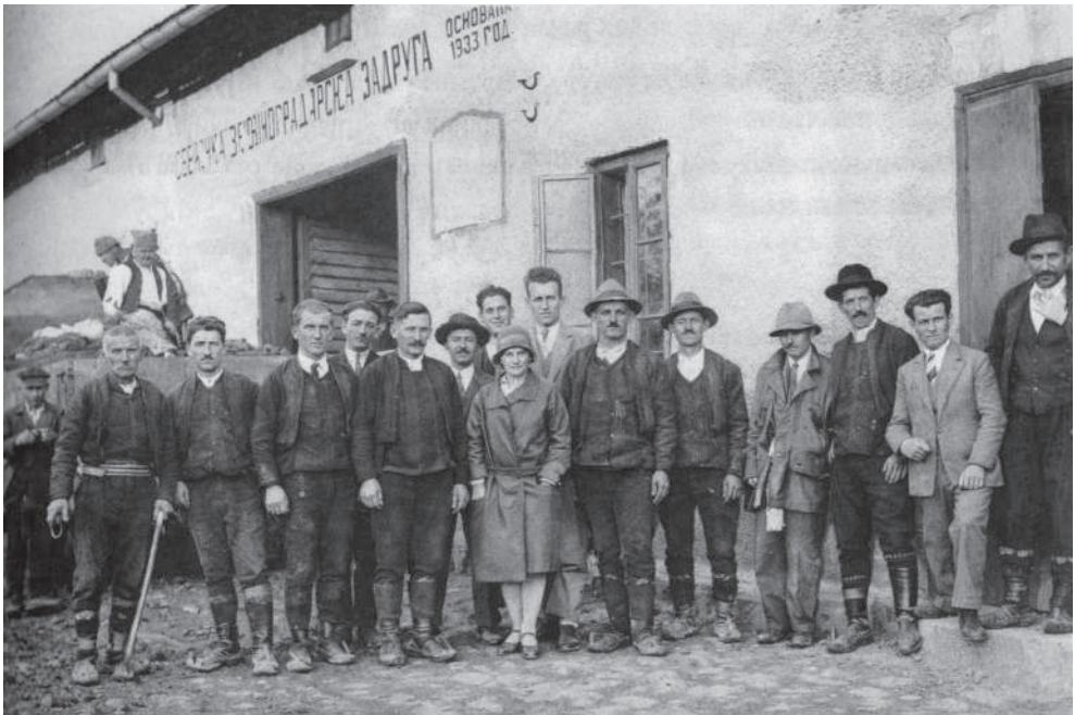
Посетиоци и задругари, фотографија из 1936. године

Задруга је била понос Краљевине Југославије, а вина су продавана и у Западној Европи и Америци. Као додатне занимљивости и својеврсни „детаљи“ који говоре у прилог великом успеху и популарности винског подухвата наших предака су следећи подаци: у то време, када је било врло мало превозних средстава, 10.000 туриста посетило је 1938. године Венчанку виноградарску задругу. Међу њима је била и Елеонора Рузвелт, супруга председника САД, која је посетила винарију 1953. године. 1