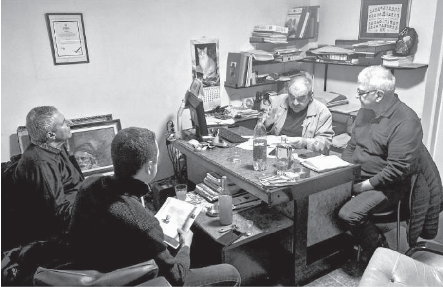
Део чланова Удружења на састанку поводом обележавања Бадњег дана на Старом тргу, децембар 2025.