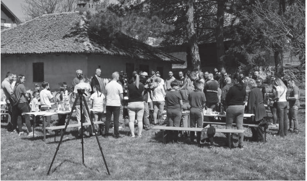
Традиционално осликавање васкршњих јаја у Етно дворишту