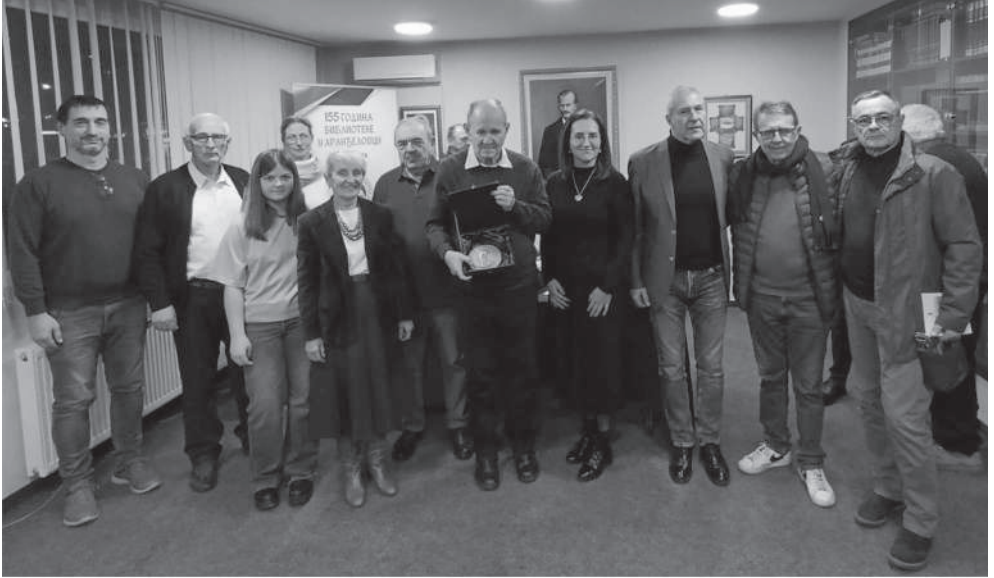
Са доделе признања „Миле Недељковић“