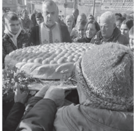
Бадњи дан 2025. Традиционално окупљање на Старом тргу